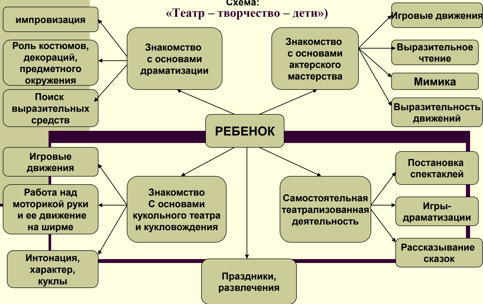
Схема: «Театр – творчество – дети»)